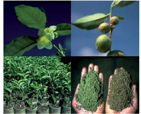
Teeblüte, Tee Früchte, Stecklinge, Teeblätter vor- und nach der Fermentation

Tee ist ein immergrünes Baumgewächs mit gelblich-weißen Blüten und hartschaligen, der Haselnuss ähnlichen Früchten. Teepflanzen gedeihen in subtropischen bis tropischen Breiten zwischen dem 38°N und dem 38°S. Für den erfolgreichen Anbau der Teepflanzen gibt es eine Vielzahl klimatischer Voraussetzungen. Dazu gehören durchschnittliche Jahrestemperaturen von mindestens 18°C mit Höchstwerten von 32°C im Schatten, kein bzw. nur seltener und mäßiger Frost, täglich mindestens vier Stunden Sonne und gleichmäßig über das Jahr verteilte Regenfälle von wenigstens 1.600 Litern auf den m 2 . Die Teepflanze, die eine über sechs Meter lange Pfahlwurzel entwickelt, braucht einen tiefgründigen, gut durchlüfteten, nährstoffreichen und leicht sauren Boden. Bergregionen werden zum Teeanbau nicht nur wegen ihrer Sonnenlagen bevorzugt, sondern ebenso aufgrund der Möglichkeit zur Entwässerung, denn die Teepflanze verträgt keine Staunässe. In vielen Anbaugebieten schützt man Teepflanzungen durch Schattenbäume vor zu starker Sonneneinstrahlung und Bodenerosion.